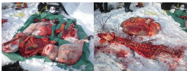
À gauche : Bison éviscéré et dépecé comme il se doit. Toute la viande a été retirée de la carcasse.

Les seules parties de l'animal qu'on devrait laisser sur le terrain sont les viscères, la colonne vertébrale et, si on veut, la tête et la peau. On peut laisser les autres os seulement si toute la viande en a été retirée. Il est interdit de laisser de la viande sur le terrain.